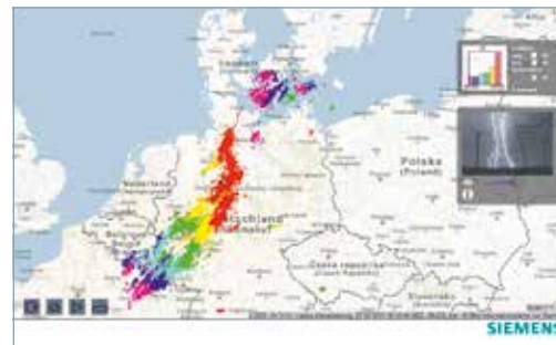
Visualisierung der Gewitterfront; Gewitterwarnung auf mobilen Endgeräten

Sehen Sie selbst, wie schnell das Einrichten geht und Sie blitzschnell vorsorgen können: siemens.de/blids .